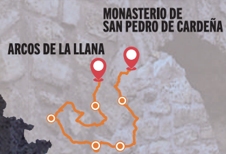
Santa María del Campo