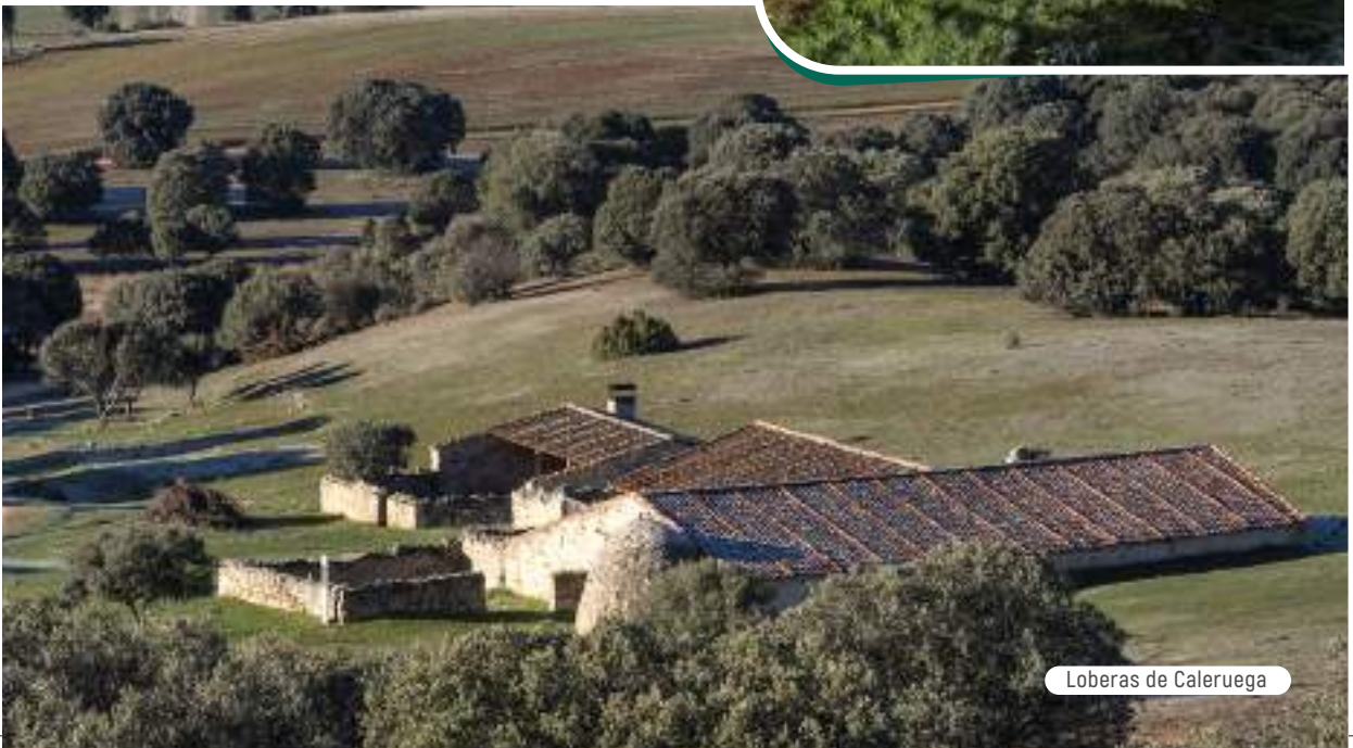
Loberas de Caleruega