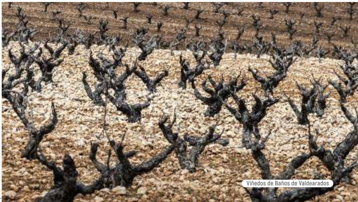
Viñedos de Baños de Valdearados

CON ESTE CÓDIGO QR PUEDES SEGUIR EL RECORRIDO DE LA RUTA EN GOOGLE MAPS