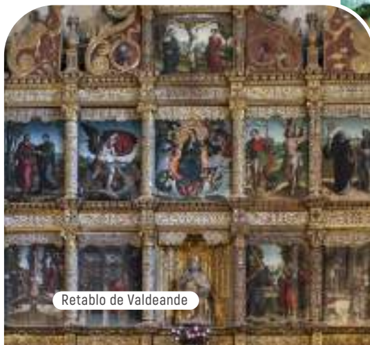
Retablo de Valdeande

Toda la zona que estamos recorriendo pertenece a la D.O. Ribera del Duero y eso se nota en el paisaje, en el que despuntan los añosos viñedos, y en la arquitectura popular.