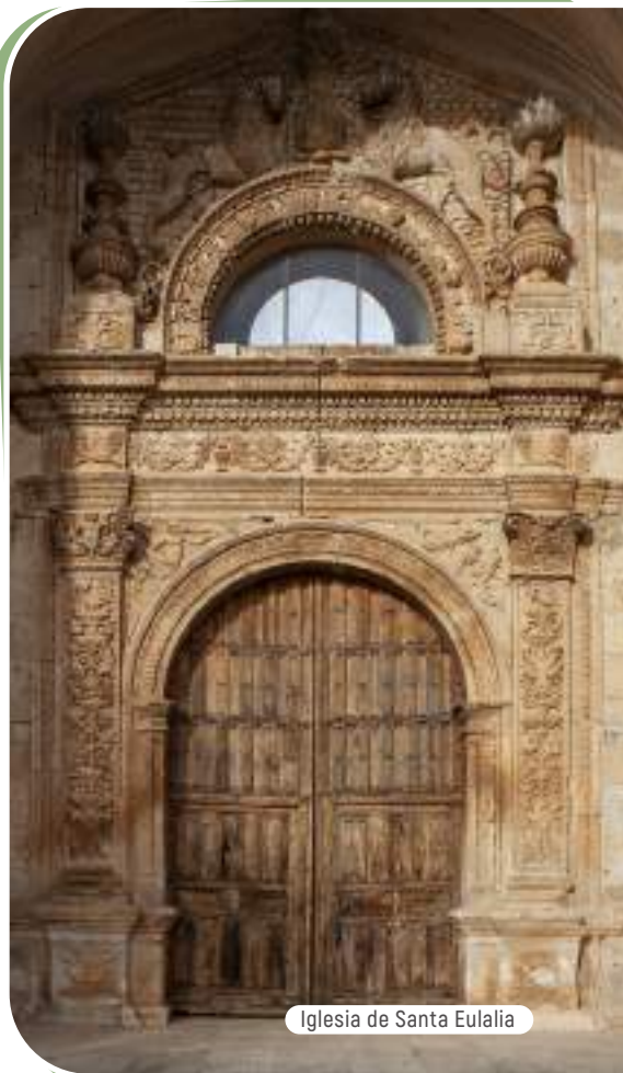
Iglesia de Santa Eulalia

Por una carretera local que sigue el curso del río Aranzuelo se llega hasta Arauzo de Salce, que guarda una inesperada sorpresa medioambiental: el embalse del arroyo de Sinovas. Construido para regular el regadío de la comarca, se ha convertido en una valiosa zona húmeda para numerosas especies de aves. Desde cualquier punto de sus casi cinco kilómetros de costa pueden observarse, según la época del año, la rara y majestuosa águila pescadora, el pequeño andarríos y, entre otros muchos, ánade friso, cerceta común, silbón europeo, gaviotas reidora y sombría, cormorán grande, garza real, somormujo lavanco y aguilucho lagunero.