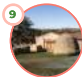
LOBERAS DE CALERUEGA