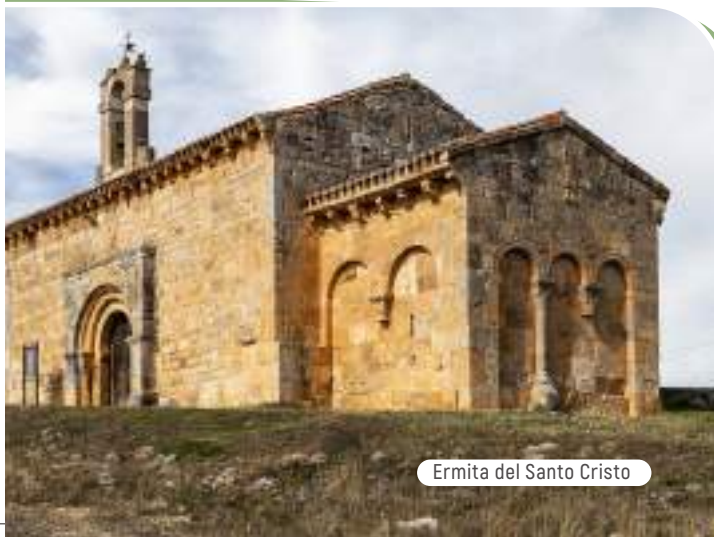
Ermita del Santo Cristo

La decoración exterior del ábside — en cuya fábrica se reutilizaron muchos materiales romanos procedentes de Clunia — se organiza mediante una serie de arcos ciegos, ligeramente peraltados, distribuidos en sus tres muros. El muro oriental presenta tres arcadas con aristas boceladas que se apoyan en alargados capiteles y altos fustes; los de las fachadas laterales muestran solo dos arcos, de aristas vivas y decoración más simple.