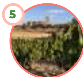
PEÑARANDA DE DUERO