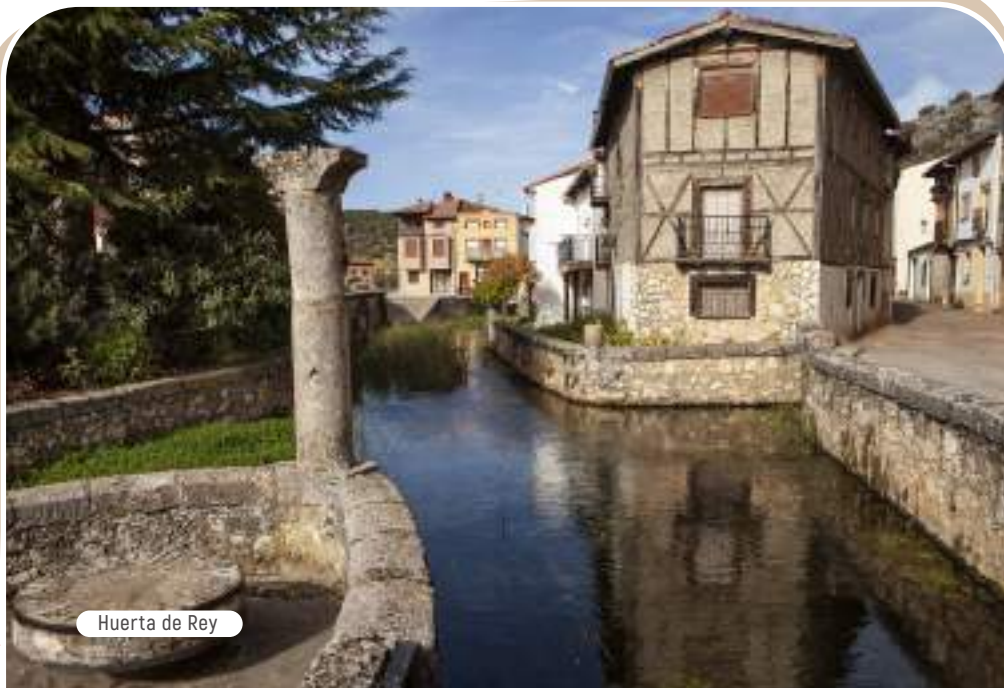
Huerta de Rey

Herótida, Neomisía, Procopio, Aproniano, Etelvina, Hierónides, Burgundófora, Canuto, Dulcardo, Ursicina, Batilde o Austringiliano fueron nombres frecuentes entre sus vecinos. Todo se debió a la afición de un secretario del ayuntamiento que, para evitar la duplicidad de los nombres más comunes, recurría al martirologio.