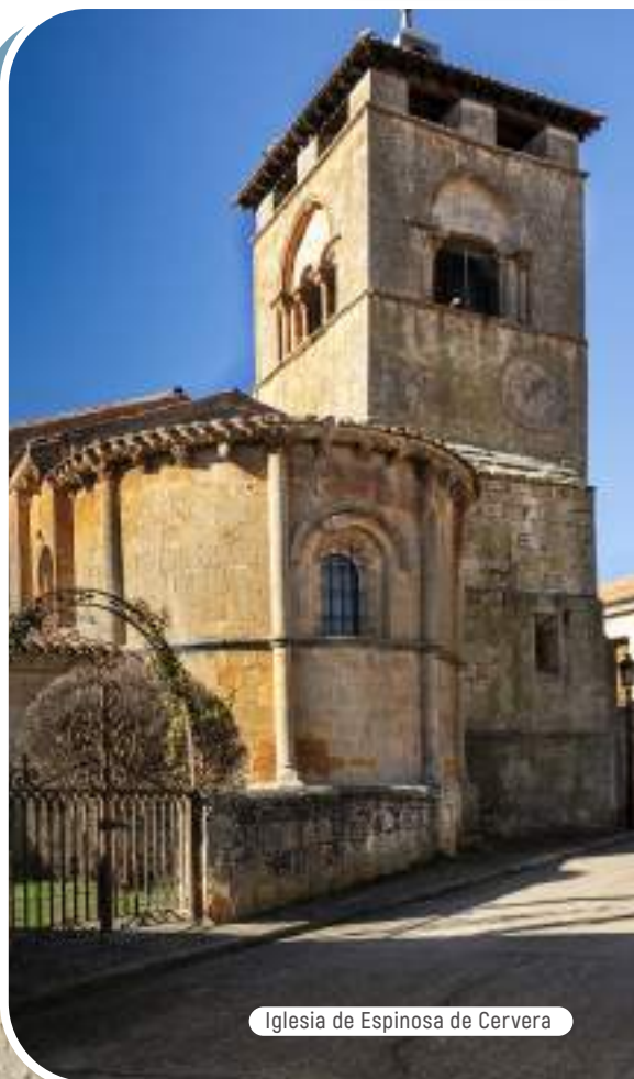
Iglesia de Espinosa de Cervera