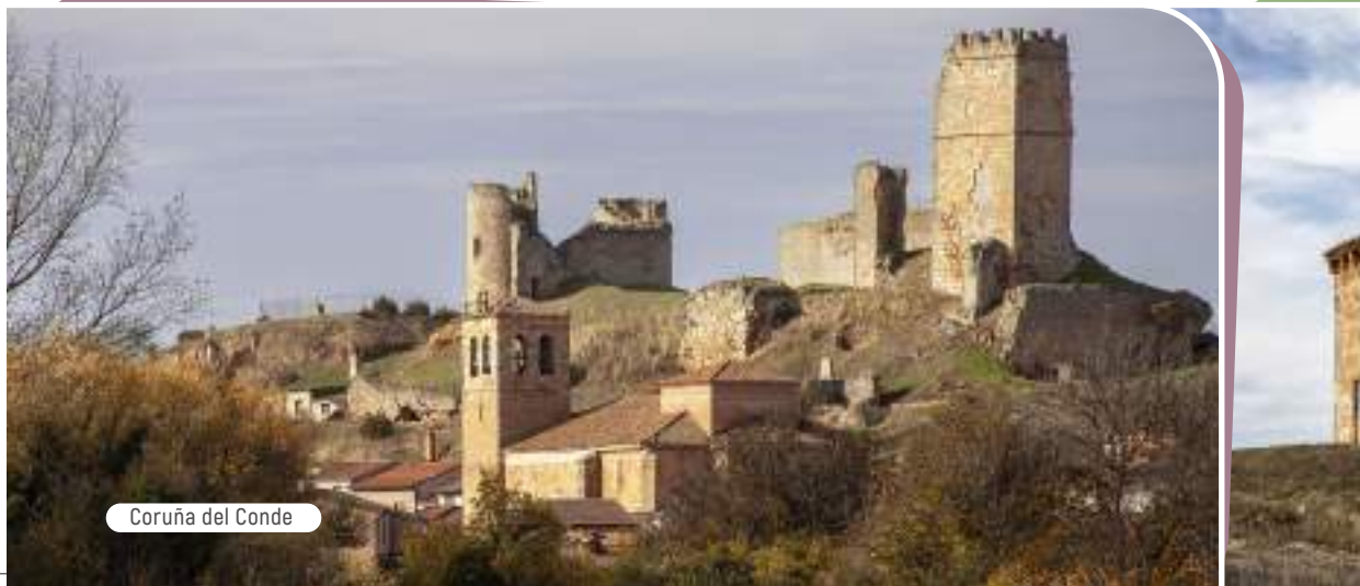
Coruña del Conde

La tarde del 15 de mayo de 1793 se lanzó al vacío desde lo alto del castillo, realizando un recorrido de más de 350 metros. Este auténtico pionero de la aviación, sin duda el primer hombre que realizó el mítico sueño de volar, terminó su planeo debido a la rotura de una sujeción del ala derecha de su artillugio.