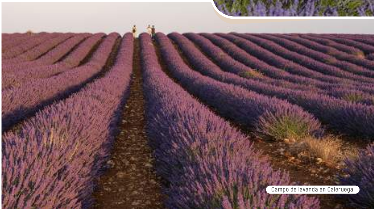
Campo de lavanda en Caleruega