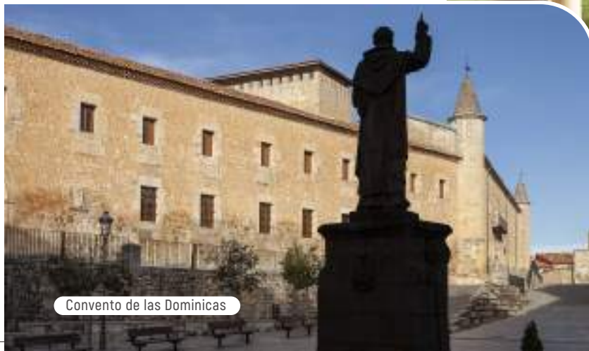
Convento de las Dominicas