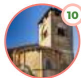
ESPINOSA DE CERVERA