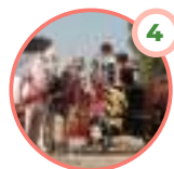
FIESTA DE BACO