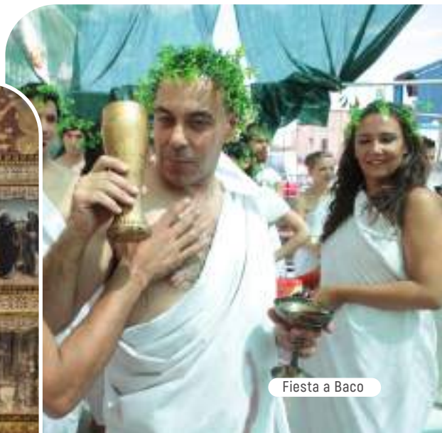
Fiesta a Baco

Nuestro recorrido pasa por Tubilla del Lago para llegar a Baños de Valdearados, ya en la vega del río Bañuelos, donde se encontraron los restos de la villa romana de Santa Cruz. Fechada en los siglos IV y V, su salón principal apareció pavimentado con un mosaico dedicado, como no podía ser de otra manera, al dios Baco. En memoria de este hallazgo se celebra todos los años en la localidad la concurrida Fiesta a Baco.