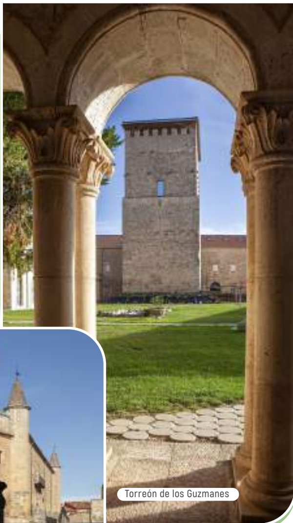
Torreón de los Guzmanes

Entre otras dependencias pueden recorrerse el coro de las monjas —que formaba parte de la antigua iglesia gótica y es su elemento arquitectónico más valioso—, la cripta, el varias veces reconstruido claustro y un bien dotado museo monacal.