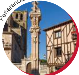
Peñaranda de Duero