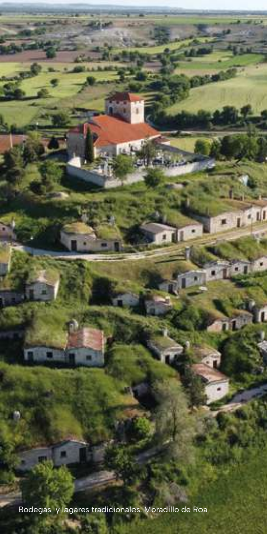
Bodegas y lagares tradicionales. Moradillo de Roa

En 1982 nace la Denominación de Origen Ribera del Duero . Desde entonces, la calidad de nuestras uvas, la variedad de suelos y el clima privilegiado han hecho que nuestros vinos conquisten el reconocimiento internacional.