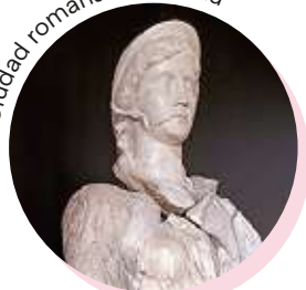
Ciudad romana de Clunia