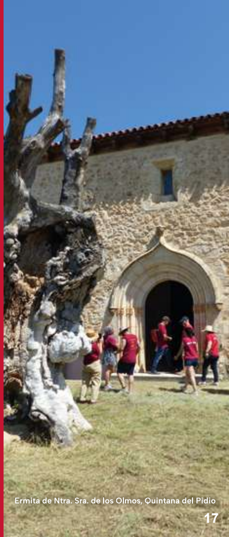
Ermita de Ntra. Sra. de los Olmos, Quintana del Pidio