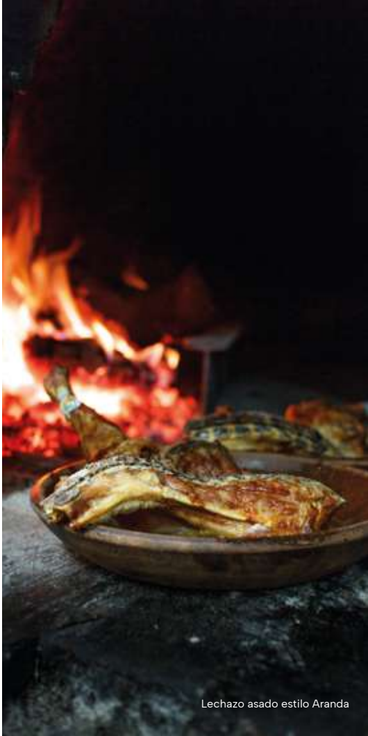
Lechazo asado estilo Aranda