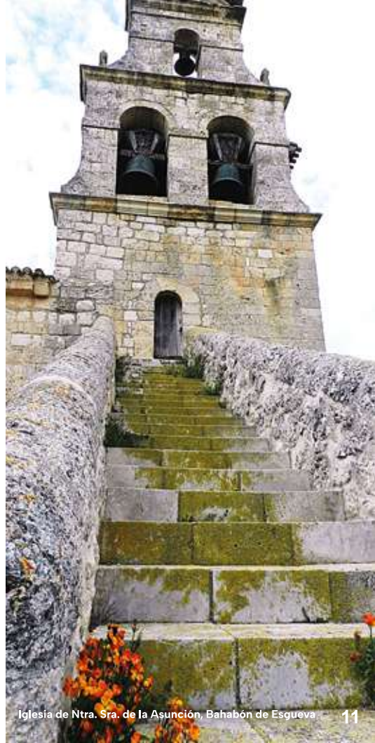
Iglesia de Ntra. Sra. de la Asunción, Bahabón de Esgueva