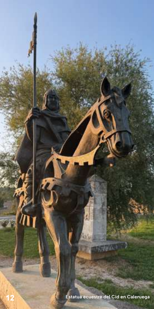
Estatua ecuestre del Cid en Caleruega