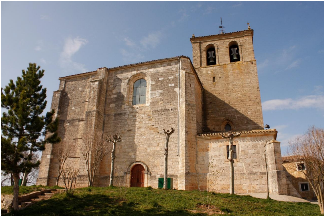
Iglesia de Nuestra Señora de la Asunción

El retablo lateral derecho está dedicado a las ánimas del purgatorio cuyo tema es San Miguel rescatando las ánimas del purgatorio.