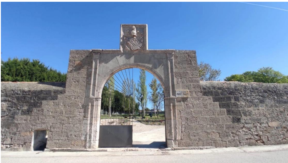
Parque de los Padres Paúles

Se puede disfrutar del nacimiento de un hermoso jardín del que los vecinos han sido partícipes, colaborando en su plantación y en la realización de las placas botánicas y elementos de decoración muy divertidos. Por el parque transcurre un riachuelo, está acondicionado con una fuente, una pista del tradicional juego de la tuta, un cargador sostenible para móviles, wifi gratuita y se puede disfrutar de mesas y bancos para comer y pasar el día a la sombra de los grandes castaños de Indias. También se puede contemplar el maravilloso mural dedicado a la mujer realizado por el artista internacional Christian Sasa.