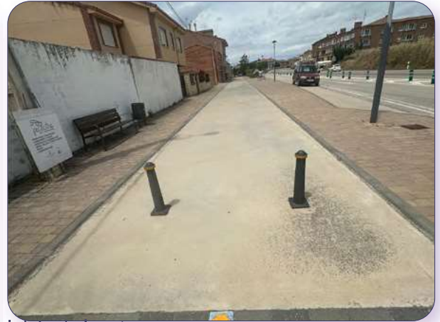
Inicio de la ruta