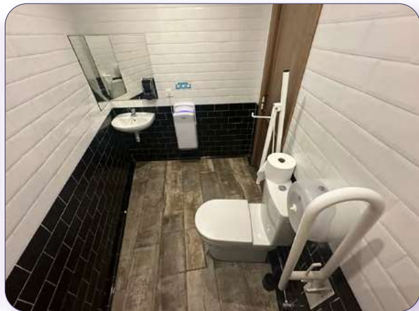
Baño para PMR