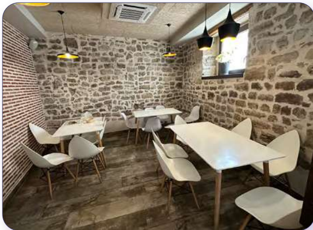
Interior de la cafetería