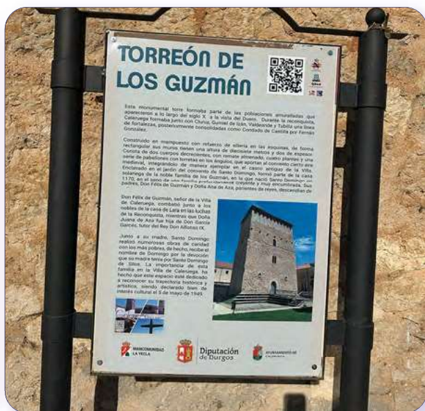
Cartel exterior de la Torre de los Guzmán