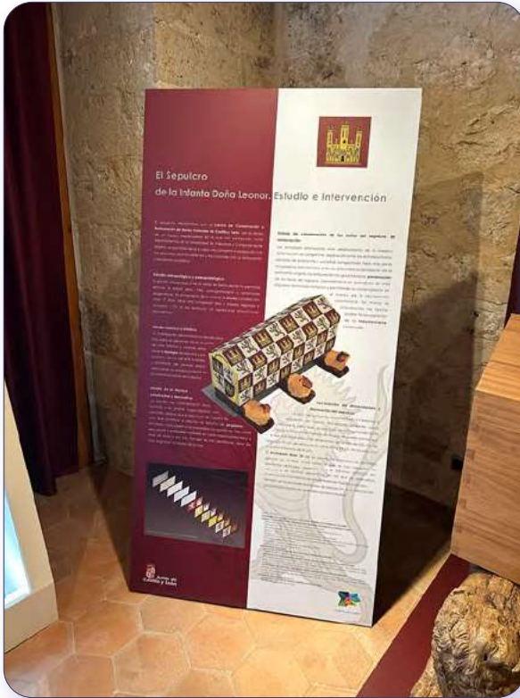
Panel expositivo sala Infanta Leonor