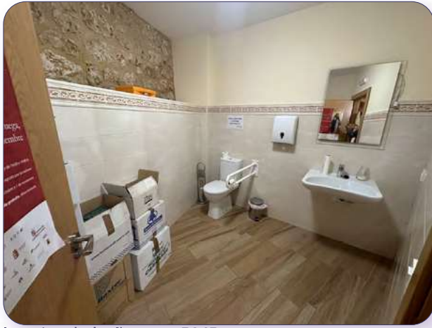
Interior de baño para PMR