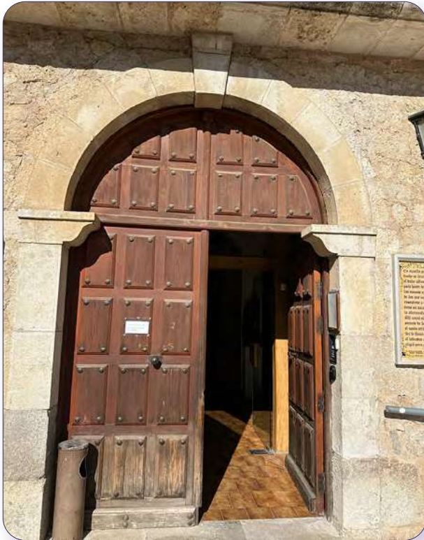
Imagen de la puerta de entrada