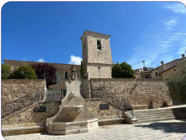
Iglesia de San Sebastián