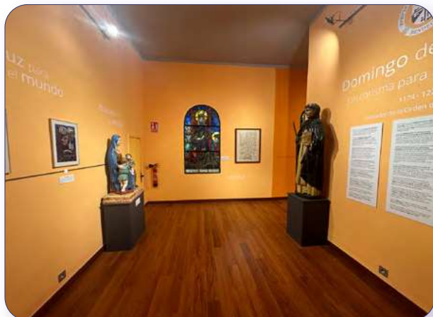
Exposición Museo Santo Domingo