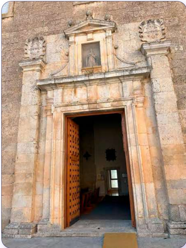
Acceso a la iglesia