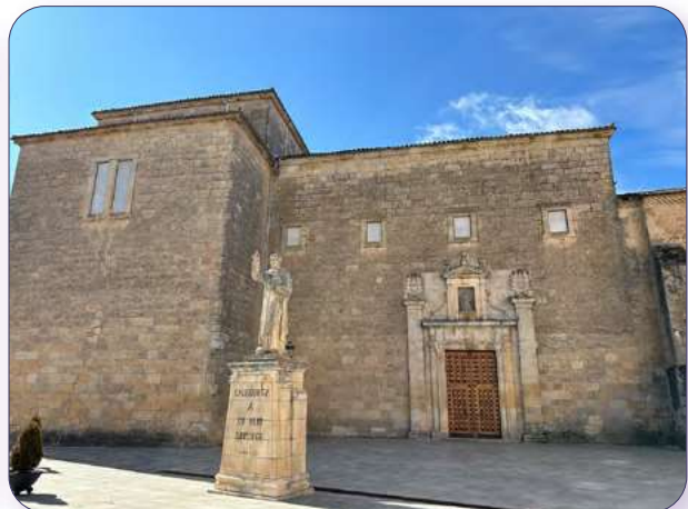
Monumento a Santo Domingo de Guzmán