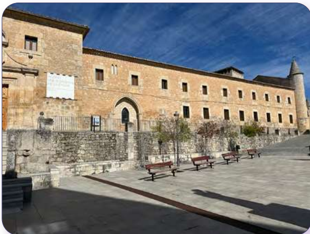
Conjunto monumental Santo Domingo de Guzmán