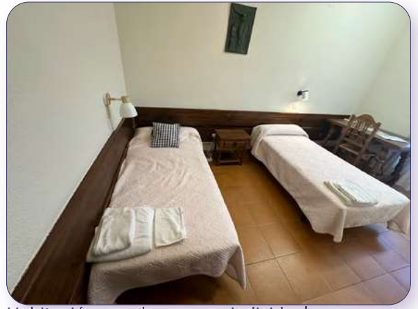
Habitación con dos camas individuales