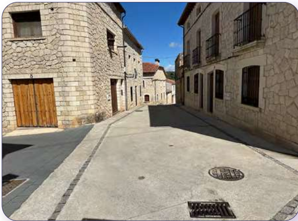
Tramo de la ruta por Caleruega