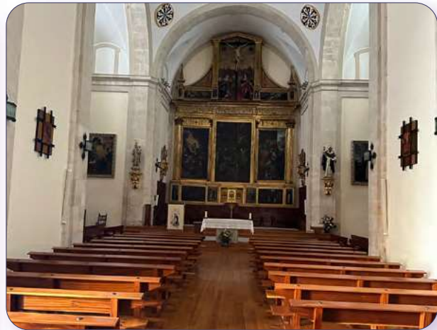
Interior de la iglesia