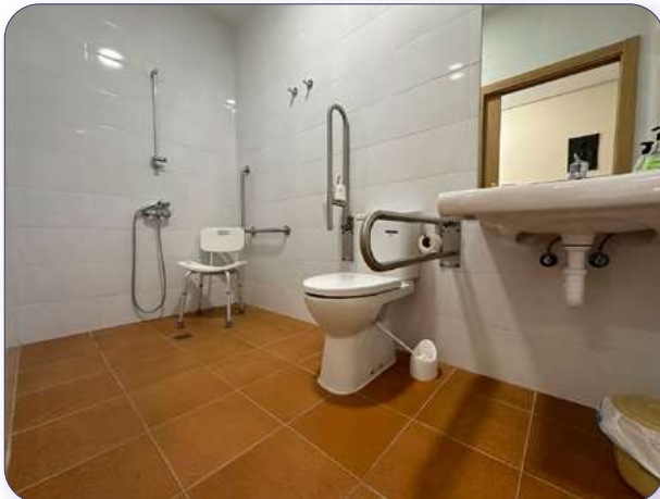
Baño para PMR