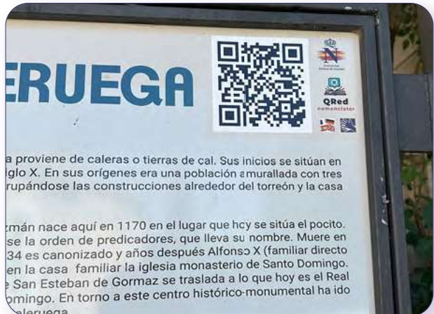
Código QR que enlaza con contenido multimedia

Diagnóstico de accesibilidad turística Provincia de Burgos | Anexo 1. Guía de Turismo Accesible Burgos