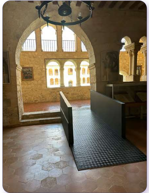
Rampa de acceso al Claustro