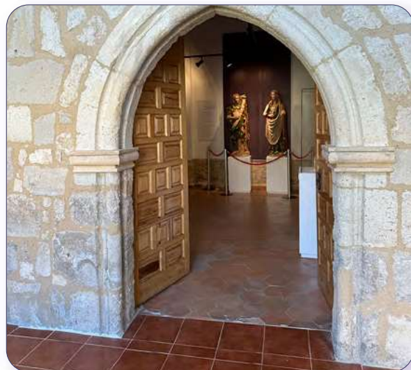
Acceso sala Infanta Leonor