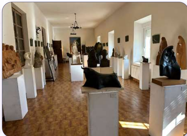
Museo Fray Alfonso Salas