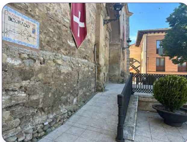
Rampa de acceso lateral