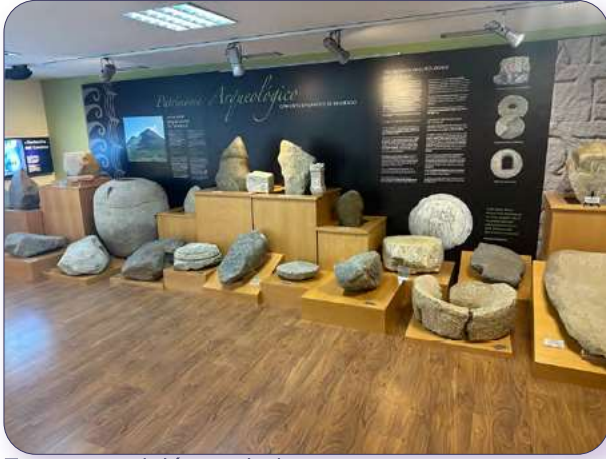
Zona exposición yacimiento