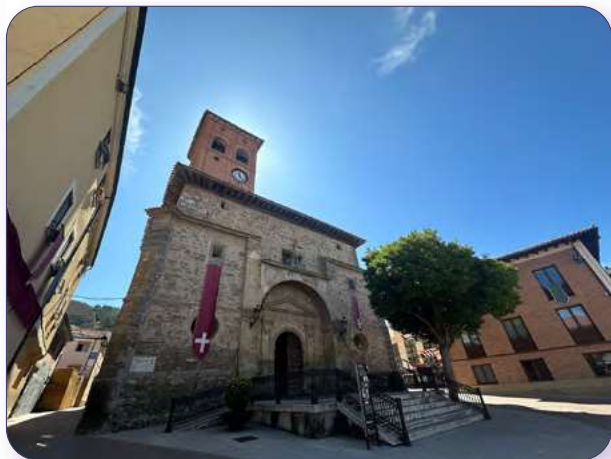
Iglesia de San Pedro