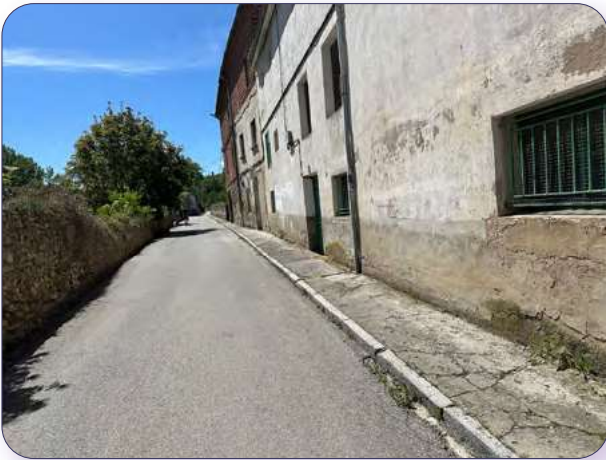
Calle que va a la ermita