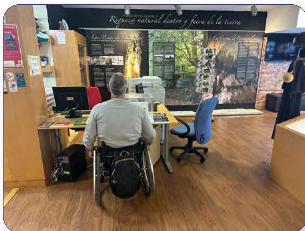
Recepción accesible PMR