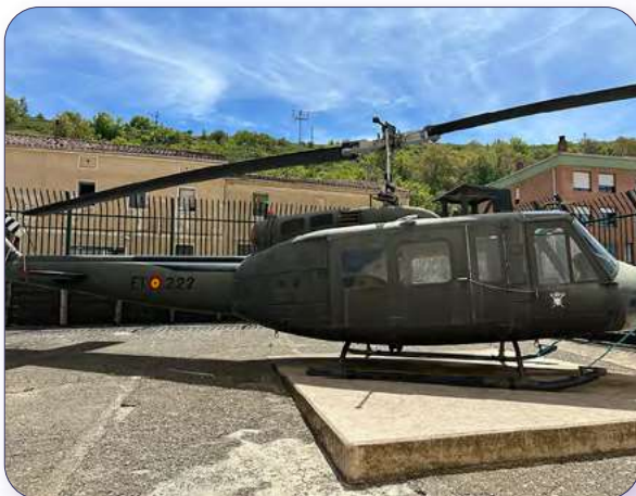
Helicóptero de Guerra

Diagnóstico de accesibilidad turística Provincia de Burgos | Anexo 1. Guía de Turismo Accesible Burgos