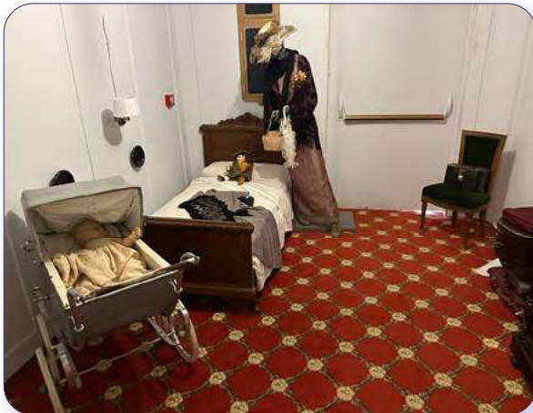
Camarote del Titanic