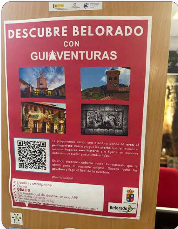
QR para audioguía