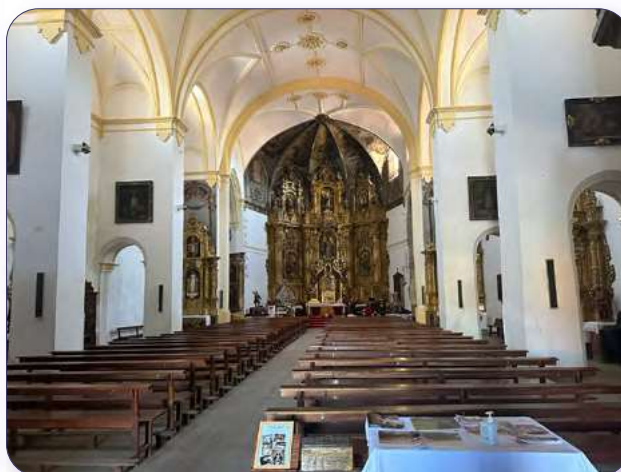
Interior de la iglesia