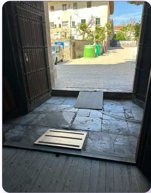
Rampas de acceso