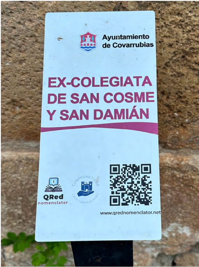
Cartel identificativo del recurso.