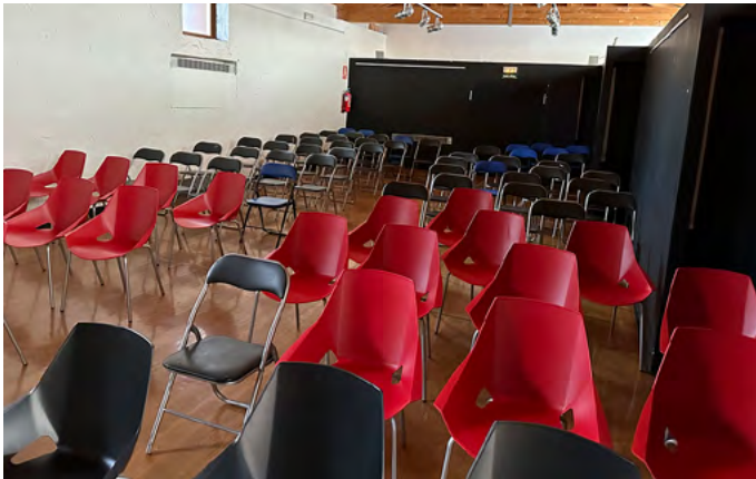
Interior de la sala