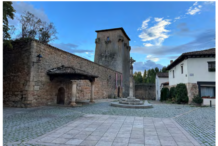
Plaza de Doña Sancha