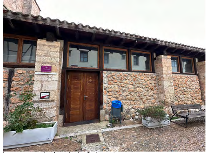
Imagen exterior de la Sala Arlanza.