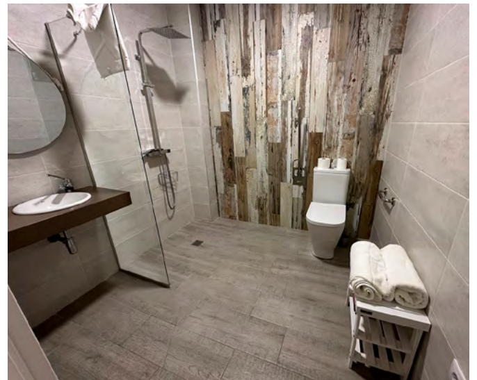
Interior del baño.