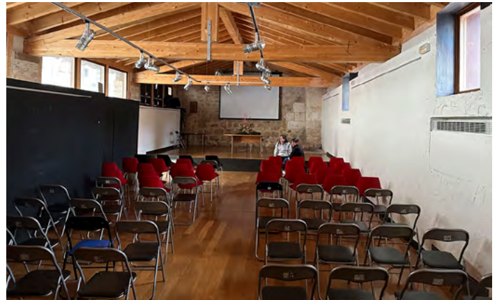
Interior de la sala