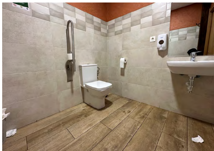
Interior del baño adaptado.