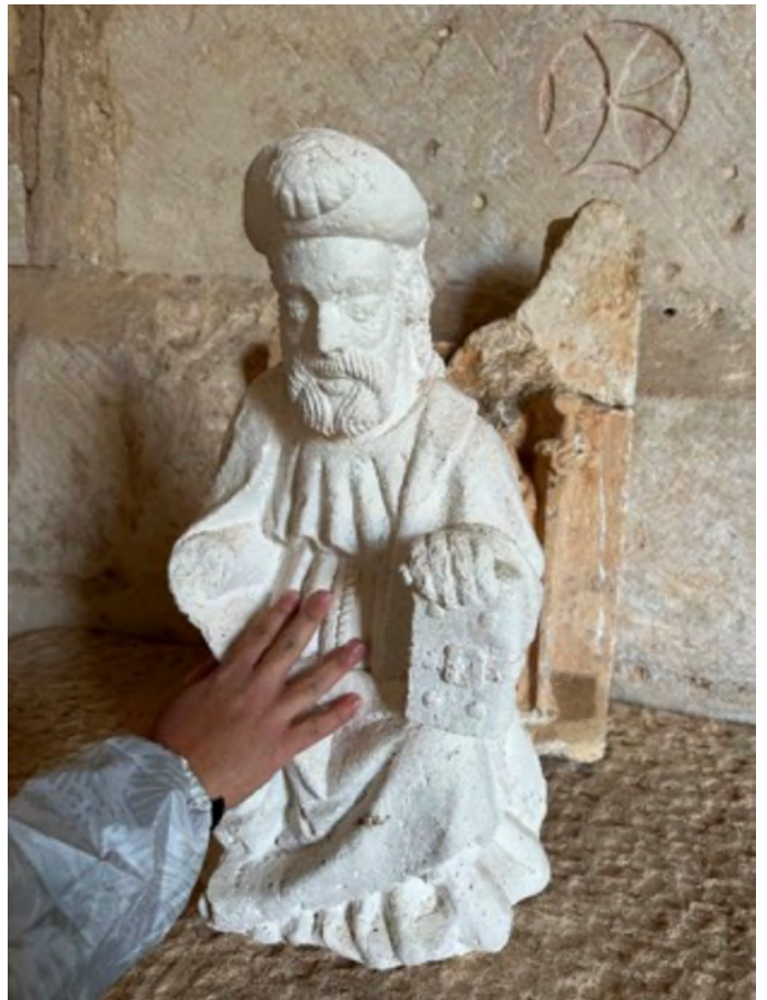
Réplica de busto de Santiago.