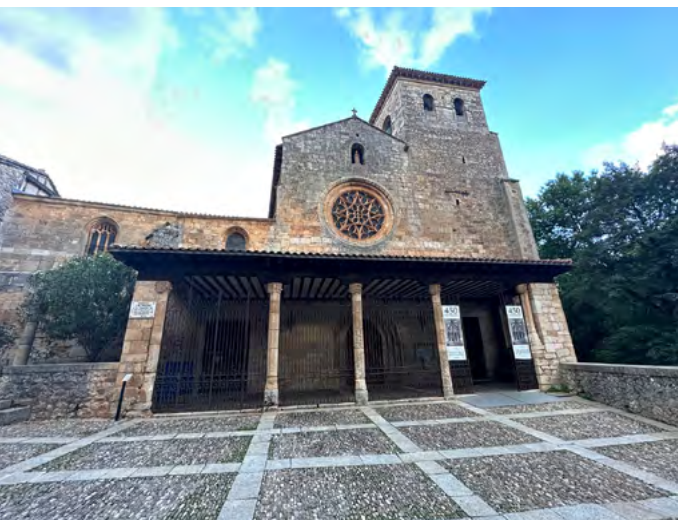
Ex colegiata de San Cosme y San Damián.