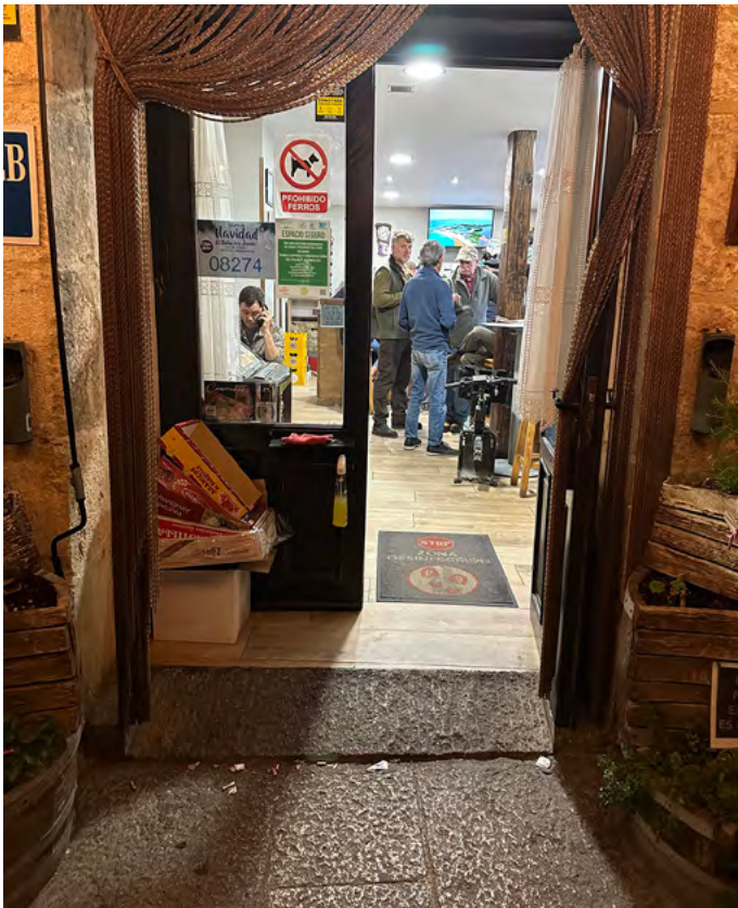
Acceso al bar.