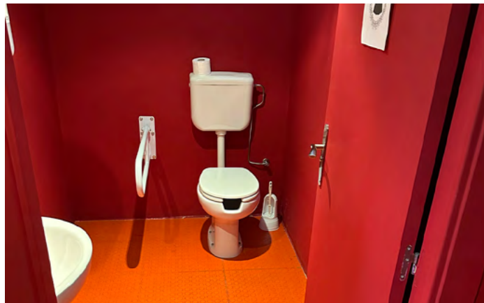
Interior de cabina.