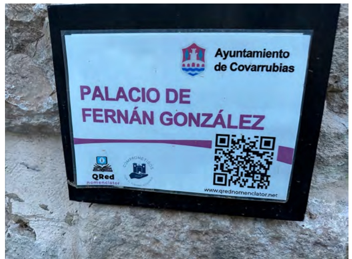
Panel con QR.