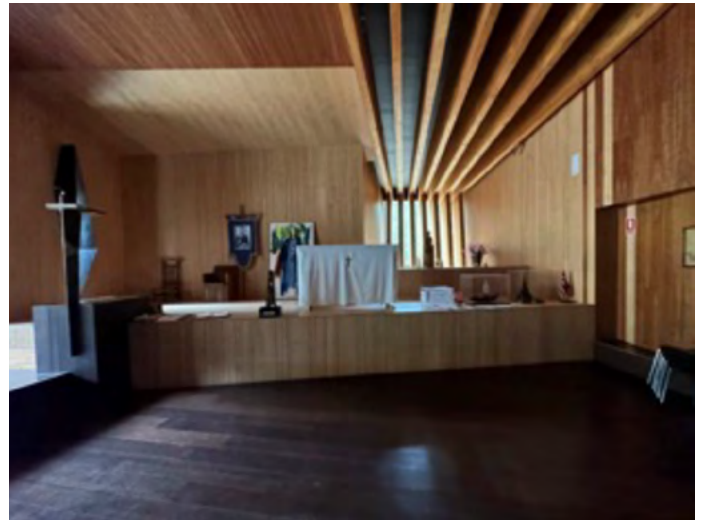
Interior de la ermita.