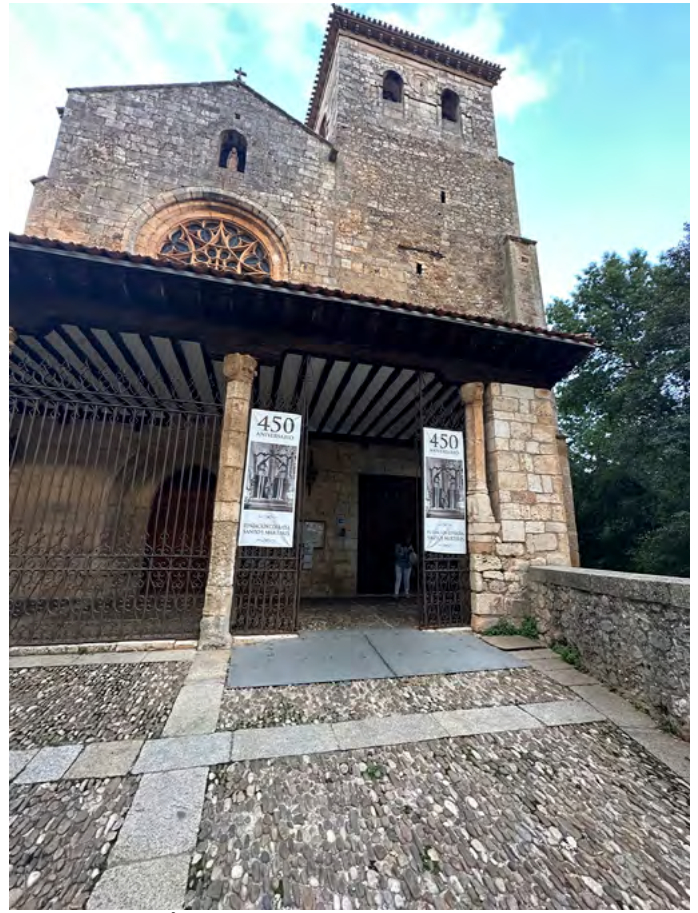
Entrada a pórtico.